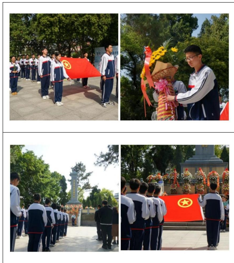
图34：闽清职专“2025年”百园千校清明祭英活动

返程大巴上，2024级电商班的同学们自发建起“红色故事采集”微信群。这个清明节，他们计划走访闽清11个乡镇，用短视频记录散落民间的英雄记忆。正如活动总策划赖校长所说：“当孩子们主动弯下腰擦拭墓碑，当‘爱国’从口号变成指尖的温度，这场跨越时空的对话就有了真正的意义。”