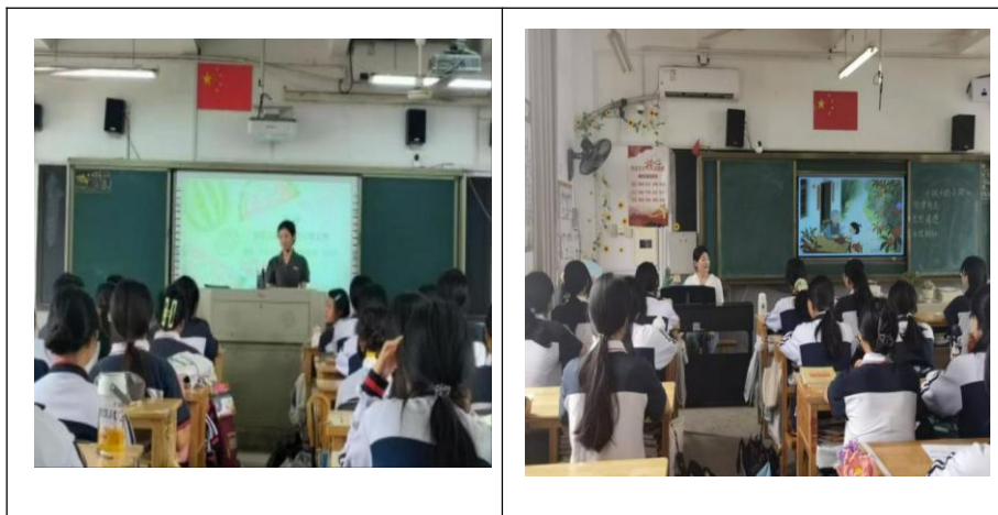
图26：闽清职专开展县级教学开放日活动

活动分成了上下午两场，上午是来自五所学校的教师带来20节精彩纷呈的公开课，覆盖8大专业（学科）领域：数学、美术、幼儿保育、旅游、音乐、平面设计、体育、钢琴。20位执教教师充分运用“学习通”“班级优化大师”等智慧教育平台，深度融合AI技术，以“如盐在水”的育人艺术，将知识传授与价值引领有机统一。每一堂课程都经过精心设计既注重专业实训技能的强化训练，通过情景模拟、项目实操等多样化教学方式，切实提升学生的实践操作能力；又巧妙地将课程思政元素融入教学内容，使学生在专业学习的过程中潜移默化地接受德育教育，实现