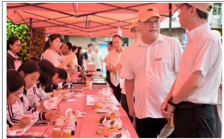
图21：幼儿保育专业——手工制作技能