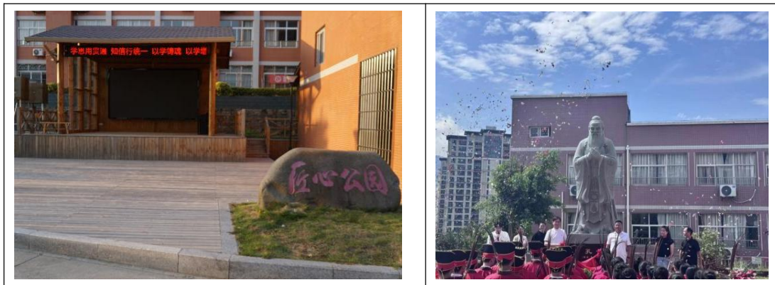
图39：建强党建文化阵地

1. 建强党建文化阵地。整合党员活动室、文化墙、匠心公园、孔子广场等设施，突出党团标识，强化宣传引导，实现功能、审美与教育功能统一。