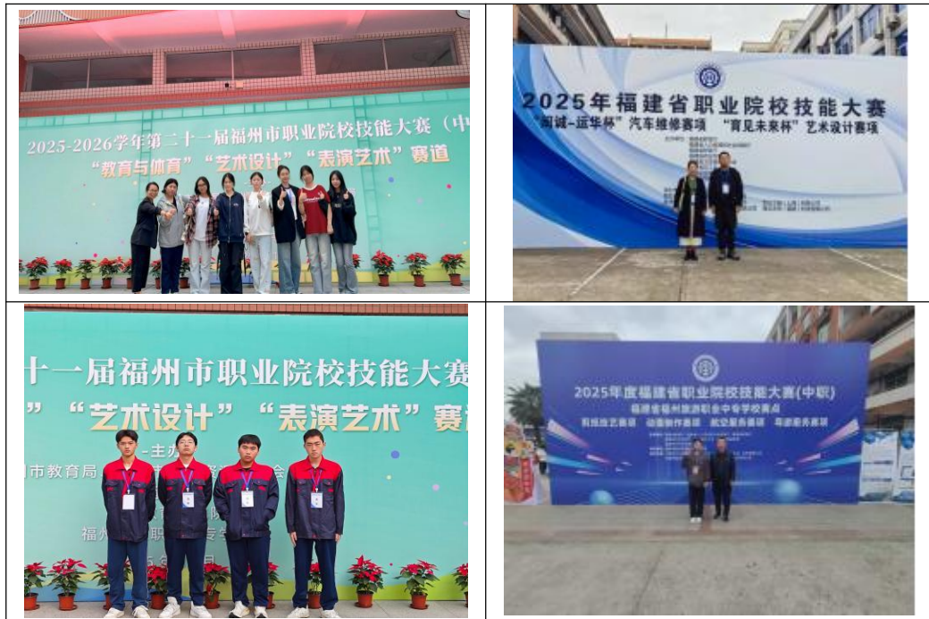
图7：2025年度闽清职专技能竞赛获奖成果