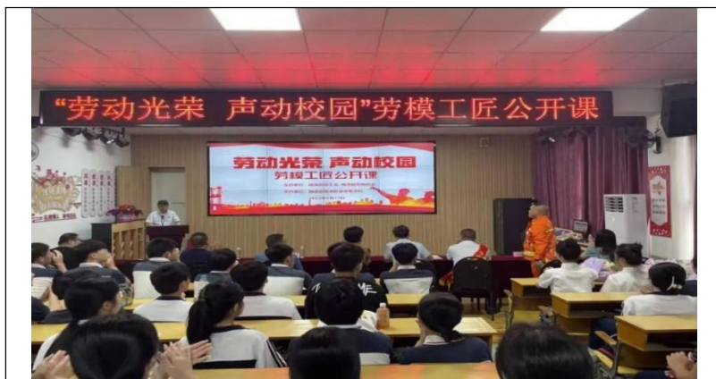
图40：培养学生核心素养

2. 铺设“三力”育人体系。坚持“五育并举”，以培养学生核心素养为目标，探索有活力、有动力、有潜力的德育体系，锤炼学生“三心”，推进德育工作科学化、特色化。