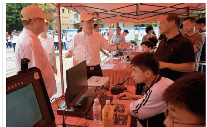
图22：计算机网络专业——电脑安装与维修技能