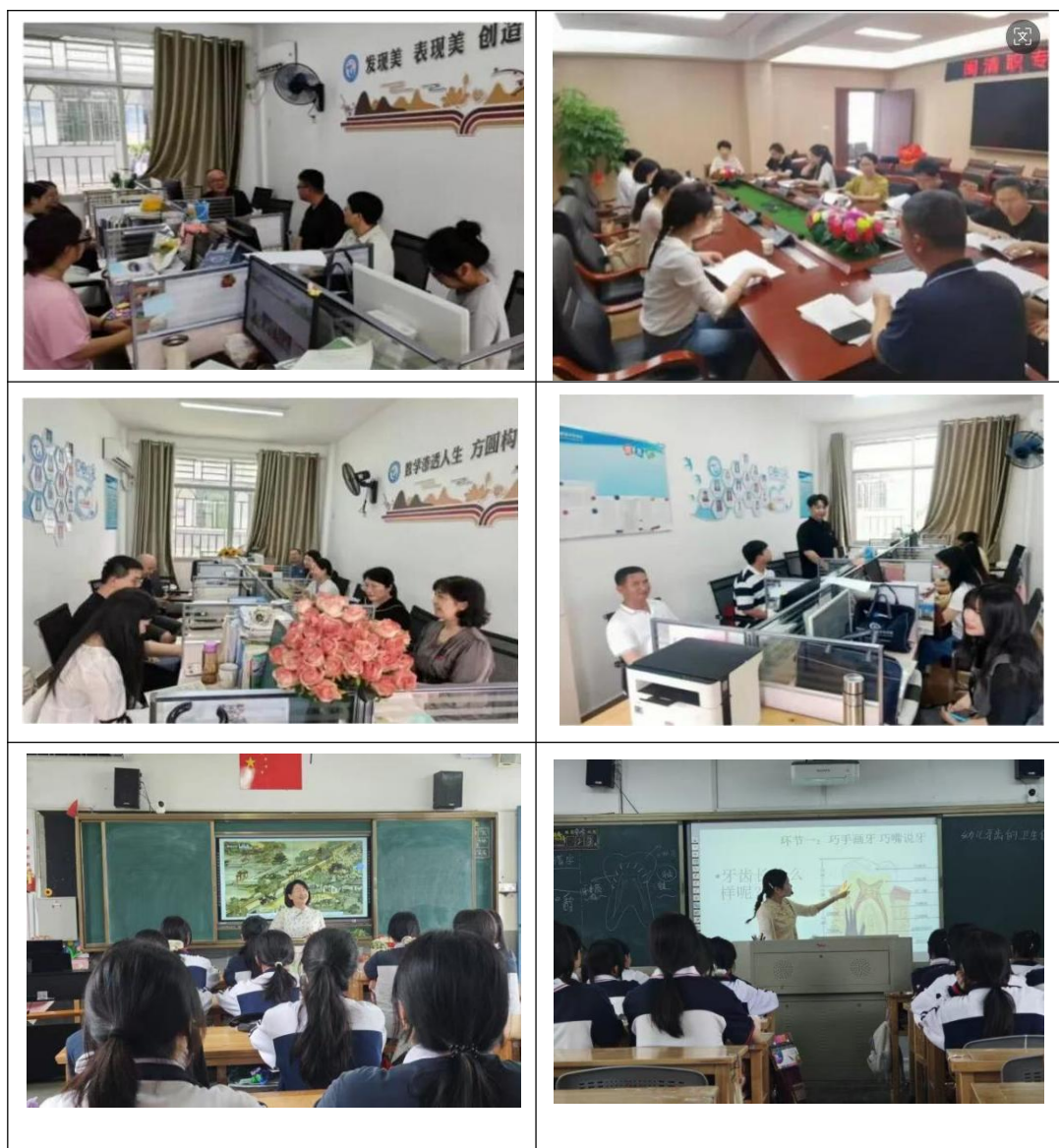
图27：闽清职专开展县级教学开放日活动

观摩结束后，各学科围绕课程开展深度教研。开课教师从教学设计理念、教学策略创新等维度进行系统说课，听课教师则从教学目标达成、课堂生态构建等多视角展开专业评议。大家既高度肯定授课教师精湛的教学技艺与创新实践，又结合教学实际提出优化建议，思维的火花在研讨中不断迸发，为课堂教学改革提供了新思路、新路径。