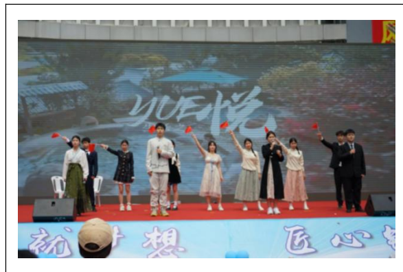
图18: 朗诵《山水闽清·向党汇报》