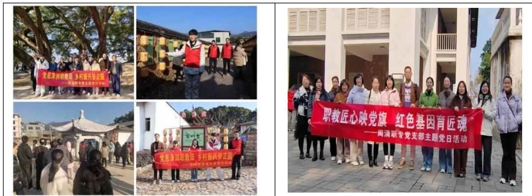
图38：闽清职专党支部主题党日活动