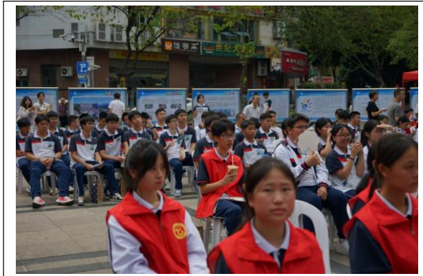
图11：闽清多部门联办活动，三百余人齐聚见证

本次活动由闽清县教育局主办，闽清县中华职教社、闽清县总工会、闽清县人力资源和社会保障局协办，福建省闽清职业中专学校承办。闽清县人民政府副县长陈秀宜，福州市委教育工委副书记、市教育局党组成员、副局长念琪，福州市教育局职成处处长郑玲，闽清县委统战部常务副部长林剑云，闽清县人力资源和社会保障局党组书记、局长、四级调研员许长林，闽清县总工会常务副主席、四级调研员张朝晖，闽清县教育局党组成员、闽清职专书记校长陈友水出席仪式。福建欣享悦实业有限公司陈福波董事长、福建豪业七叠温泉景区开发有限公司朱宗晟董事长、闽清县文化旅游投资有限公司刘思炜董事长、闽清职专全体班子成员、中层干部、有关教师、学生及社会各界人民群众，300余人欢聚一堂，见证这一重要时刻。