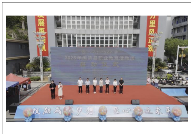
图10：闽清县职业教育活动周启动仪式

为传承中华优秀传统文化，弘扬新时代工匠精神，2025年5月16日上午，2025年闽清县职业教育活动周启动仪式在闽清县乃裳广场隆重举行。