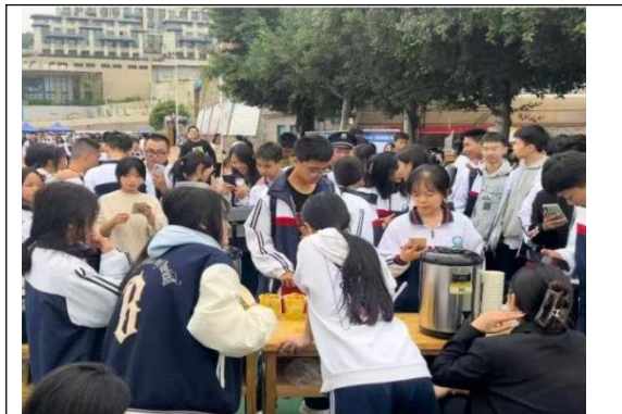
图6: 闽清职专22级电商专业校运创业实践纪实