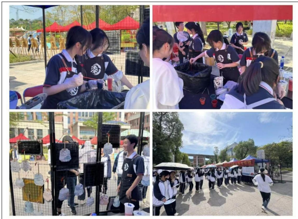
图35：校外漆艺技艺交流活动

基于本地人才需求状况和深入的企业调研分析，并结合学校自身实际，我校在专业建设方面取得了显著成果。在县政府的大力支持下，我校开设了非遗专业工艺美术（漆艺），传承地方文化精髓，培养特色专业人才。工艺美术专业学生每月享受500元生活补助，保障非遗人才培养。学校将非遗文化融入校园文化建设，通过“匠心公园”“匠心大舞台”等阵地展示非遗作品，组织学生参与非遗技艺交流活动，助力福建漆艺等非遗项目的保护与传承。