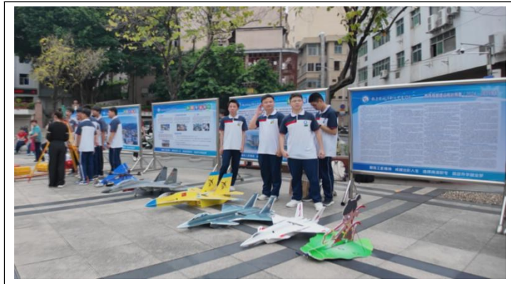
图23: 电子专业——自制飞机模型展示