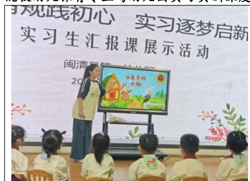
图5：中职院校幼儿保育专业与幼儿园实习实训深度融合案例