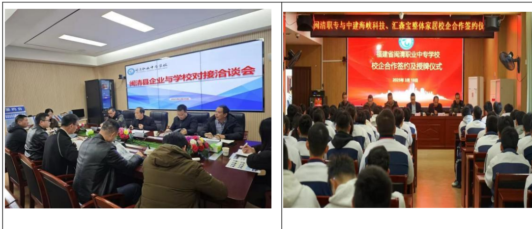
图8：就业双选会现场