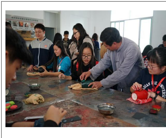
图32：企业大师进校园活动

此次参观学习活动中，是闽清职专校团委深化红色教育的重要举措。通过实地研学，让红色文化真正走进学生心里，不仅丰富了同学们的精神文化生活，更激励大家将红色精神转化为学习和工作的动力，以实际行动传承红色基因，为学校发展和家乡建设贡献青春力量。