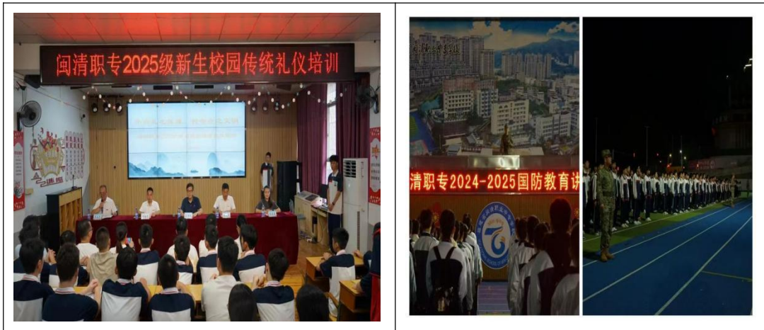
图41：强化实践育人加强心理健康教育

4. 打造多元育人模式。以校本培训、“青蓝工程”和“双师型”队伍建设为重点，深化教科研工作。依托高校资源，深化“岗课赛证创”融合，提升人才培养质量。