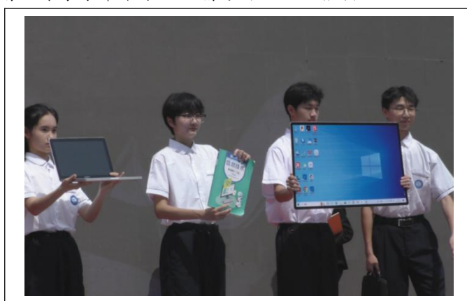
图15: 专业魅力风采绽放

《专业魅力，风采绽放》：各专业学生通过情景展示，生动演绎了建筑、旅游、电商等专业的技能特色。