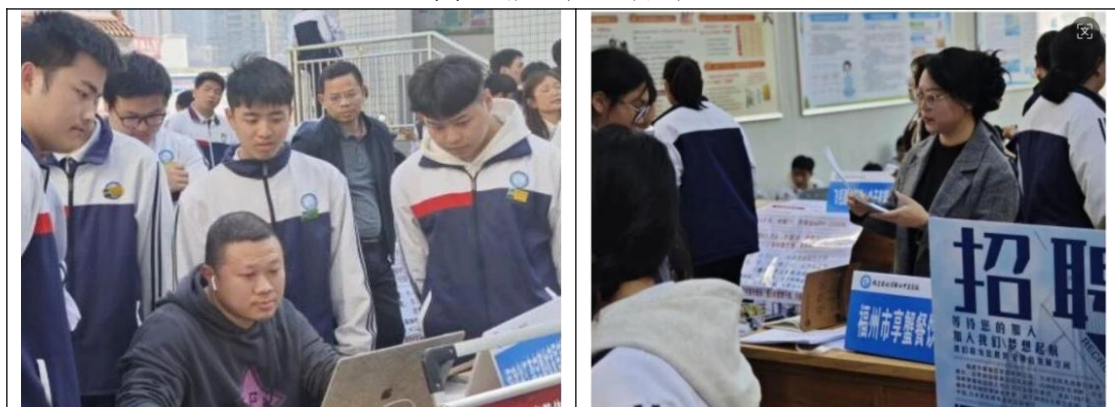
图9：校企签约洽谈现场