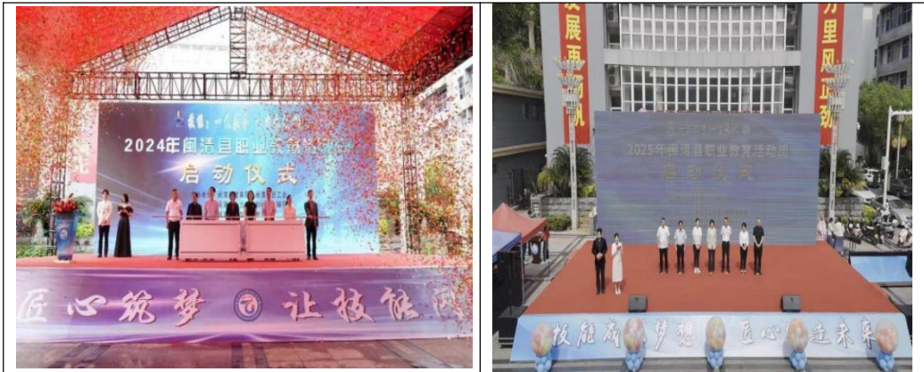
图44：职业教育活动周活动

6. 打造“先锋”育人阵地。成立“技能竞赛育人”先锋队，坚持“以赛促教、以赛促学”，每年举办职业教育活动周，选拔培育技能竞赛苗子，以匠心育人。