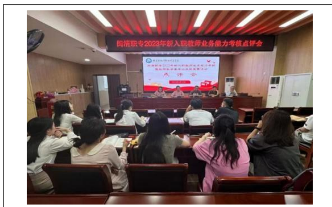
图36: 新入职教师业务能力考核点评会