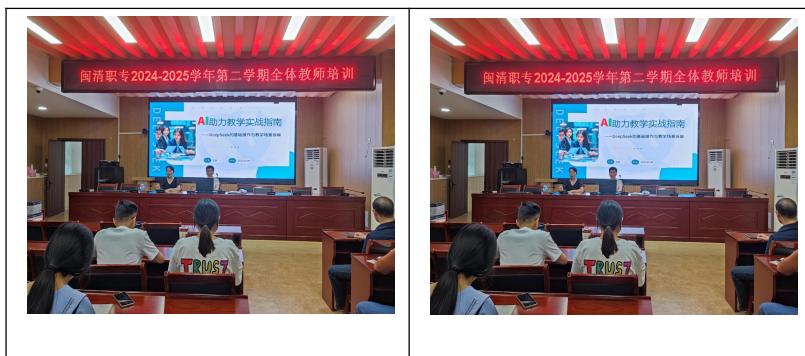
图4：AI助教学，实战提效能全体教师培训

从智能解题到创意教学设计，从班级管理到科研助力，DeepSeek的实战应用让全校教师看到了AI与教育融合的无限可能。期待全体教师以此次培训为起点，积极探索“AI+教育”的更多场景，让技术真正成为提升教学能力的“共生伙伴”，共同书写闽清职业中专学校教育创新的新篇章！