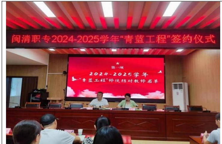
图42：深化“岗课赛证创”融合，提升人才培养质量

4. 打造多元育人模式。以校本培训、“青蓝工程”和“双师型”队伍建设为重点，深化教科研工作。依托高校资源，深化“岗课赛证创”融合，提升人才培养质量。