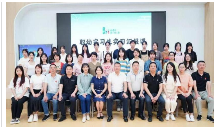
图43：推进岗课紧密衔接深化校企合作

5. 推进岗课紧密衔接。深化校企合作，依据岗位标准重构教学内容，推行“识岗—仿岗—跟岗—顶岗”的渐进式实践教学，促进知识与技能结合。