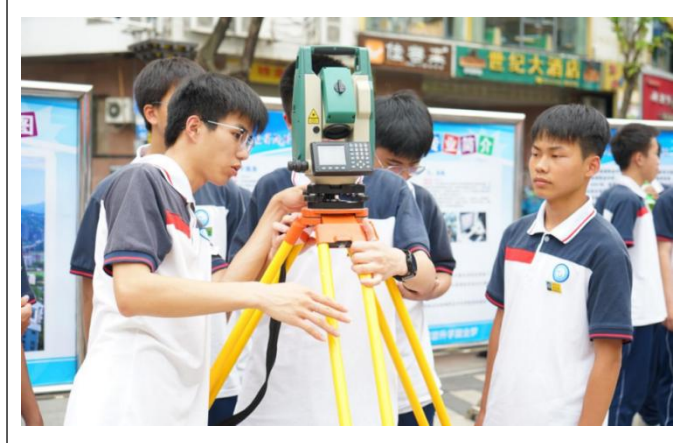
图20：建筑专业——测量技能

“艺者痴，技必良。”启动仪式结束后，领导与嘉宾移步技能展示区，近距离观摩师生们的精湛技艺：非遗漂漆、手冲咖啡展示、建筑测量仪操作……一个个项目生动展现了职业教育“产教融合、知行合一”的育人成果。