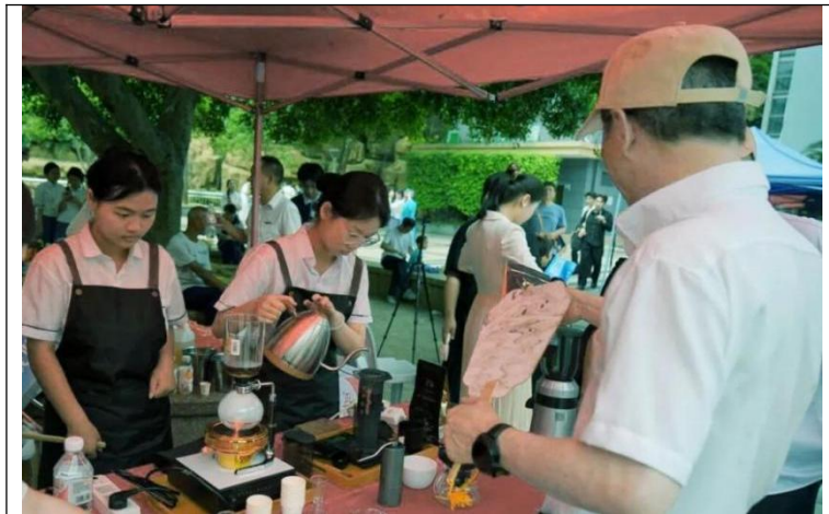
图25: 旅游专业——手冲咖啡展示

我校以活动周为契机,围绕“一技在手一生无忧”的主题,积极展示我校职业教育的办学特色和优势,扩大职业教育的社会影响,提高学校的知名度,吸引更多的学生和家长选择我校,为社会培养更多的高素质技能人才。让我们共同期待:闽清职教学子以匠心筑梦,为山水闽清高质量发展注入澎湃动能!