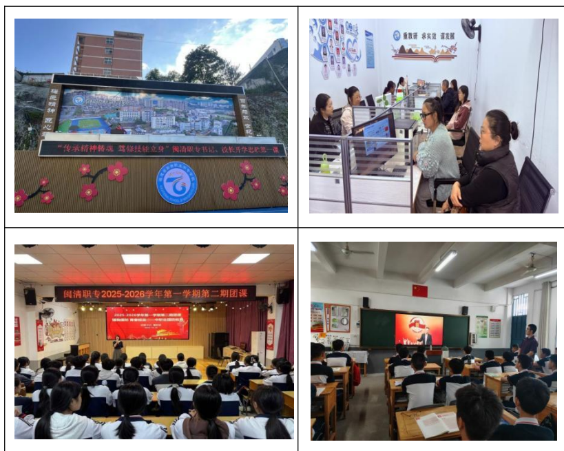
图1：开展思政第一课各项工作

此外，学校深挖闽清红色资源与地域文化，开发特色研学课程，推进大中小学思政教育一体化建设，整合校、企、家、社多方资源形成育人合力。全年思政教育成效凸显，学生思想道德素养与职业素养同步提升，校风学风持续优化，为中职学校思政贯通教育提供了可复制的实践样本。