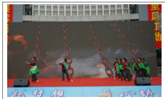
图19: 舞蹈《映山红》表演