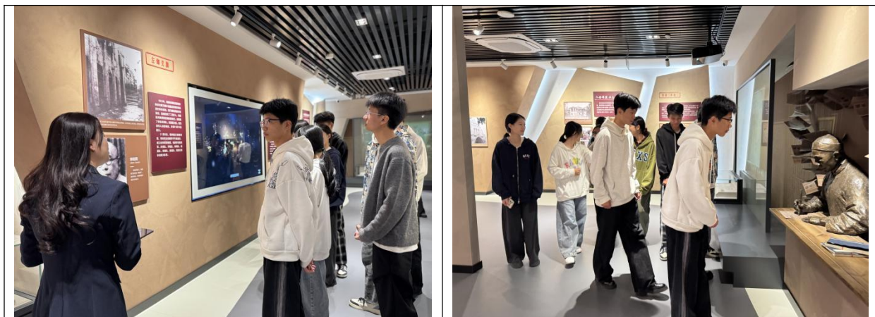
图33：闽清职专校团委组织学生会干部参观乃裳纪念馆活动